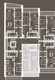
situace bytové jednotky celkový půdorys