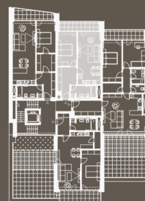
situace bytové jednotky celkový půdorys