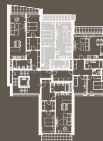
situace bytové jednotky celkový půdorys